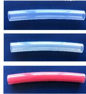
単層フッ素チューブ